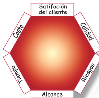
La restricción triple ampliada

Otro ejemplo sería aquel proyecto exitoso que cumple con el alcance, tiempo, costo, calidad y satisfacción del cliente. Sin embargo, si pudiera ejecutar el mismo proyecto diez veces, solamente en una de esas situaciones se obtiene un proyecto exitoso. Esto indica que el proyecto tiene un altísimo grado de riesgo.